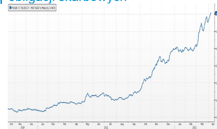
Wykres 2. Rentowność 5-letnich obligacji skarbowych